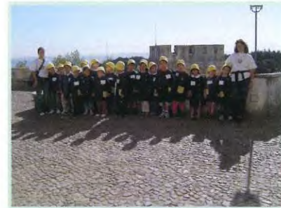
Dia 9 - Dia Mundial dos Castelos