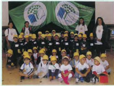
Dia 30 - Entrega do 3º. Galardão Eco-Escola