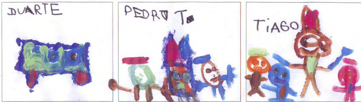
Depois quando chegamos à escola decidimos por a mão na massa e fazer um bolo: "O Bolo do Outono"