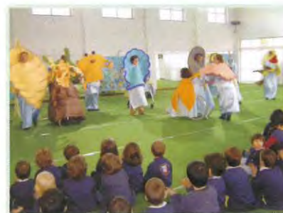
Dia 9 - Dia Internacional do deficiente Peça de Teatro "Arco-Iris" Grupo APD