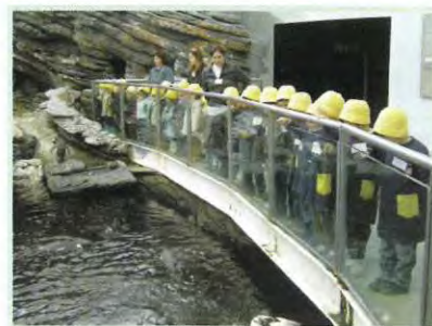
Dia 17 - Dia Nacional do Mar Visita ao Oceanário