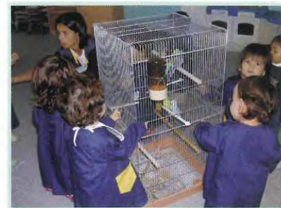
Dia 6 - Dia Mundial do Animal