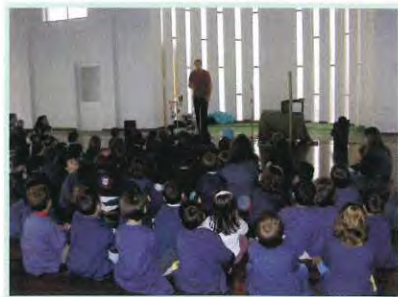
Dia 1 - Dia Mundial da Música