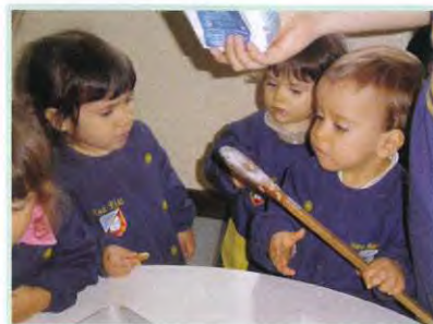
Dia 16 - Dia Mundial da Alimentação