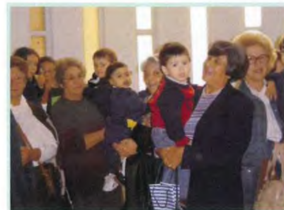
Dia 27 - Dia das Avós