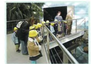
Ana Isabel - Sala dos 3 anos

GANHAMOS GANHAMOS... O 3º GALARDÃO ECO-ESCOLA!!!